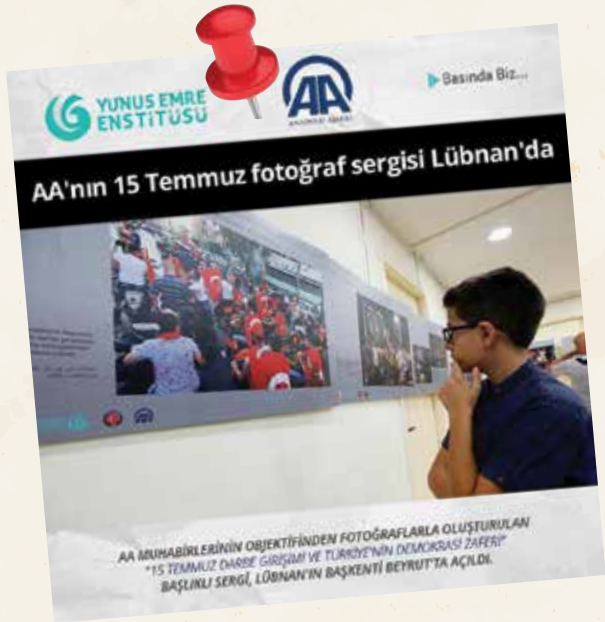
AA MUHABİRLERİNİN OBJEKTİFİNDEN FOTOĞRAFLARLA OLUŞTURULAN "15 TEMMUZ DARBE GİRİŞİMİ VE TÜRKİYE'NİN DEMOKRASİ ZAFERİ" BAŞLIKLILIK SERGİ, LÜBNANIN BAŞKENTİ BEYRUTTA AÇILDI.

Cumhurbaşkanı Erdoğan, Maarif Vakfına tüm uluslararası kuruluşların tam saha destek vermesini istedi. Yunus Emre Enstitüsü, TİKA, YTB ve Diyanet İşleri Başkanlığı dâhil olmak üzere bütün uluslararası kuruluşlar Millî Eğitim Bakanlığının muhtevasında Maarif Vakfının yurt dışında yayılması için destek verecek. Bunların yanı sıra Maarif Vakfı söz konusu ülkelerdeki sivil toplumun yurt dışı ayağının da desteğini almak için yoğun bir çalışma içine girecek. Cumhurbaşkanı Erdoğan, Vakfın yurt dışı faaliyetlerinde, FETÖ'nün yaygın ve etkin olduğu ülkelere öncelik verilmesini istedi. Bunun yanı sıra orta ve uzun vadeli hizmet planlaması yapılması gerektiğini belirterek Balkanlar, Orta Doğu ve Türkî devletlere öncelik verilmesinin önemine dikkati çekti.