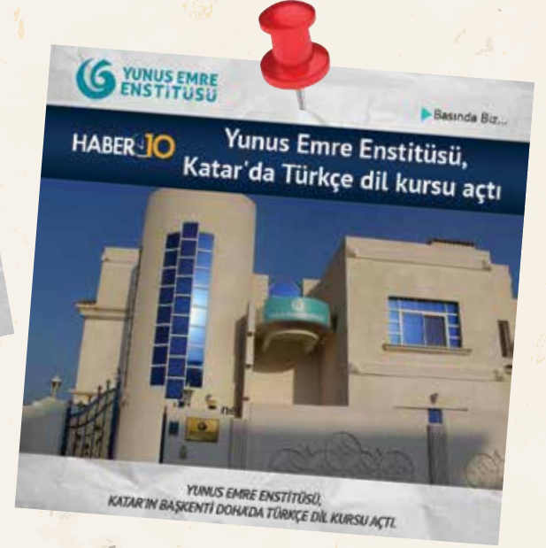
YUNUS EMRE ENSTİTÜSÜ, KATAR'IN BAŞKENTİ DOHA'DA TÜRKÇE DİL KURSU AÇTI.