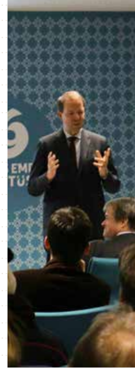
"TAŞLARIN SESİ" KONFERANSI BAŞLADI