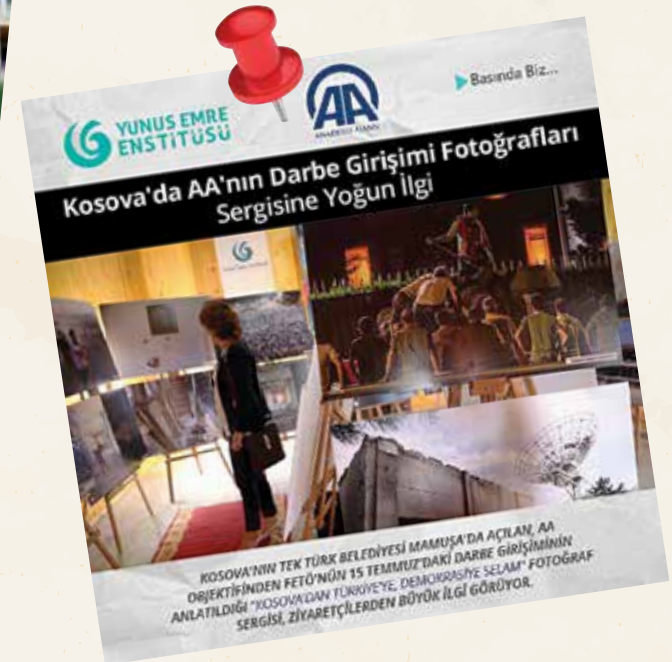
KOSOVA'NIN TEK TÜRK BELEDİYESİ MAMUŞA'DA AÇILAN, AA OBJEKTİFİNDEN FETÖ'NÜN 15 TEMMUZ'DAKİ DARBE GİRİŞİMİNİN ANLATILDIĞI "KOSOVADAN TÜRKİYE'YE DEMOKRASİYE SELAM" FOTOĞRAF SERGİSİ, ZİYARETÇİLERDEN BÜYÜK İLGI GÖRÜYOR.