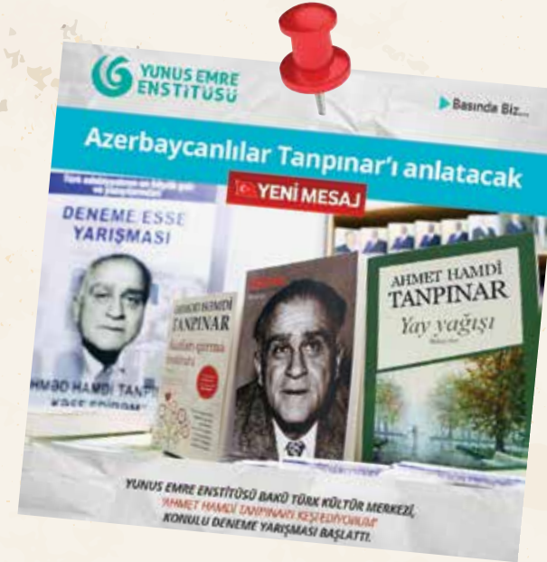
YUNUS EMRE ENSTİTÜSÜ BAKO TÜRK KÜLTÜR MERKEZİ, AHMET HAMDİ TANPINAR'IN KEŞİF EDİLMİŞ KAYITLI DENEME YARIŞMASI BAŞLATTI.