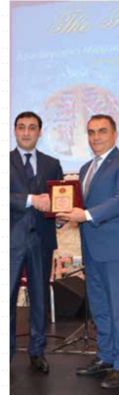
BAKÜ YUNUS EMRE ENSTİTÜSÜ "YILIN EN İYİLERİ" ARASINDA