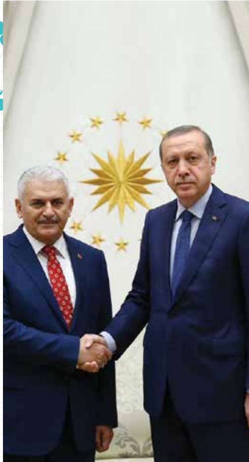
CUMHURBAŞKANI ERDOĞAN VE BAŞBAKAN YILDIRIM'DAN TÜRK DİL BAYRAMI