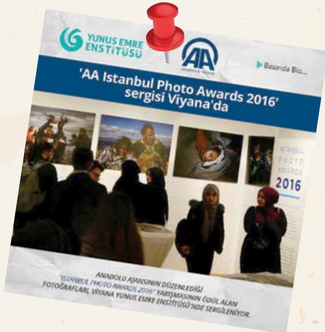
ANADOLU AKADEMİSİNİN DÜZENLEDİĞİ "İSTANBUL PHOTO AWARDS 2016" YARIŞMASININ ÖDÜL ALAN FOTOĞRAFLAR, VIYANA YUNUS EMRE ENSTİTÜSÜ'NDE SERGİLENİYOR.