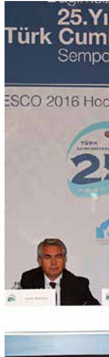
TÜRK DÜNYASIN-DA YUNUS EMRE ENSTİTÜSÜ