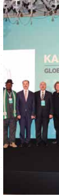
KÜRESEL KAMU DİPLOMASİSİ AĞI ÜYELERİ TÜRKİYE'DE