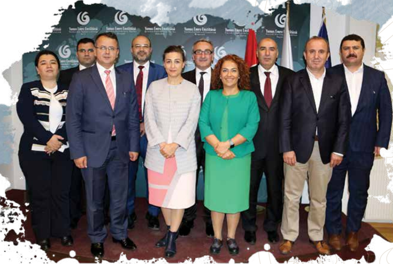
T.C. MİLLÎ EĞİTİM BAKANLIĞI HEYETİ