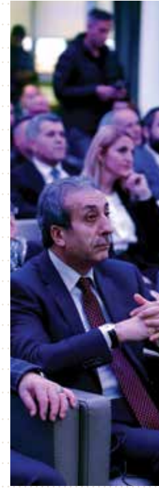
15 TEMMUZ DARBE GİRİŞİMİ SARAY-BOSNA'DA ANLATILDI