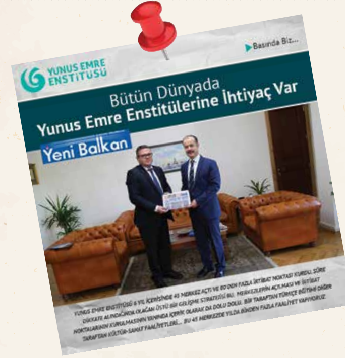
YUNUS EMRE ENSTİTÜSÜ 6 YIL İÇERİSİNDE 45 MERKEZ AÇTI VE 80'DEN FAZLA İHTİSAP NOKTASI KURULU. SÖZLEŞME ALINDIĞI GÜNLERDEN ÖZEL OLARAK ÜSTÜ BİR GELİŞME STRATEJİSİ BİLİ. MERKEZLERİN AÇILMASI VE İHTİSAP NOKTALARININ KURULMASININ YANINDA KİTAP OLARAK DA DOLU DOLU. BİR TARAFINDAN TÜRKÇE BÖYÜK ÖLÇÜDE TARAFINDAN KÜLTÜR-SANAT FAALİYETLERİ... BU 45 MERKEZDE YILDA BİRDEN FAZLA FAALİYET YAPILYOR.